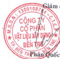
Phan Quốc Thông